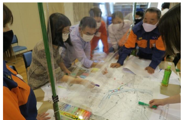
④日本人と外国人が協力して防災カップを作る様子