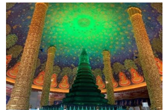
タイでインスタ映えと話題のお寺「ワット・パクナム」

気候は、そんなに変わりません。パッションフルーツなどの果物があるところも似ています。グリーンパイヤもあって、タイ料理に使えるので、嬉しいです。