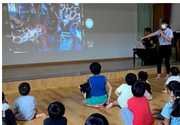
保育園訪問時の様子

幼稚園では、絵本の「はらべこあおむし」をタイ語で読んだり、タイの歌に合わせて、園児と一緒に踊りました。終わる頃には「もっとやりたい、もっとやりたい」と言ってもらえて嬉しかったです。