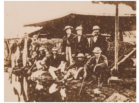
『イギリス人技師』

鹿児島市磯地区に立つ異人館は、木造瓦葺きで桜島側に張り出しの付いた独特の形をしており、建築当時は二階の4面にベランダを巡らし、壁を白い漆喰で仕上げたイギリス系のコロニアル様式であった。しかし、実はこの建物、外観こそ洋式ながら、屋根構造は日本式の和小屋組みで、柱間（はしらま）はインチやフィートではなく寸尺の単位で間取りされている。また、各部屋のドアノブはかなり低い位置 ～跪いて手を伸ばして届く高さ～ に取り付けられており、当時の日本人が障子や襖を開け閉めする際に膝をついていたことに由来するのではないかと思われる。これを見ると、元々は英国人の手による設計を、日本人大工が建てる際に見事にその異文化を咀嚼して我がものとなした様がよくわかる。