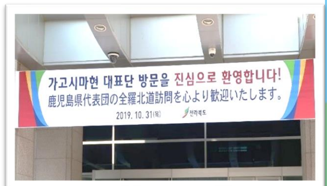
【全羅北道庁の入り口_歓迎のメッセージ】