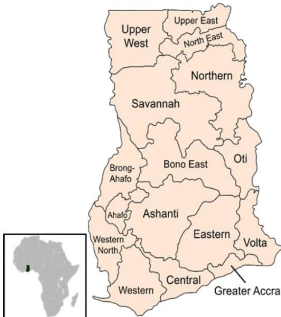
図 1 アフリカ大陸とガーナ共和国

ガーナといえば、カカオの産地のイメージを持たれている方も多いと思いますが、他にもマンゴー・パイナップルなどの産地でもあります。公用語は英語ですが、約80 の現地語からなる多言語国家です。(因みに、私の派遣地はダバニ語でした)