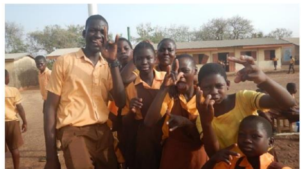
図 3 活動先の子どもたちの様子

私の配属先は、ガーナ北部のノーザン州ポンタマレにあるサベルグ聾学校で、幼稚部から中学部までの全寮制の公立学校です。この学校で、小学 2 年生から 6 年生に ICT 授業を行う事がメインの活動でした。授業の進め方は、パワーポイントを見せながらガーナ手話で簡単に説明した後に演習やフラッシュカードなどを活用し、遊びながらパソコンの基本的な専門用語を覚える取り組みをしていました。