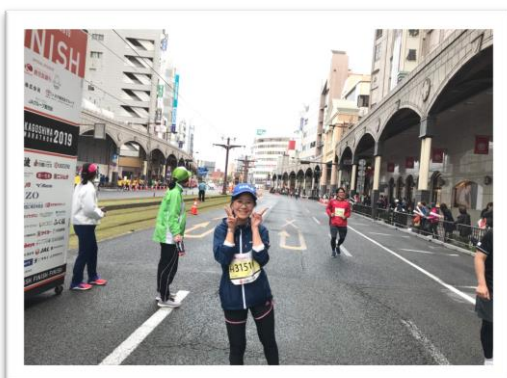
今年の鹿児島マラソンに参加

さて、近年、鹿児島県におけるベトナム人をはじめとする在留外国人数は、増加傾向にあります。日本に初めて来た人、日本語ができない人、知り合いが誰もいない外国人は、日常生活で困ることが多いのではないのでしょうか。今後は（公財）鹿児島県国際交流協会に新しく開設された「外国人総合相談窓口」の生活相談専門員として、これまで鹿児島で学んだことや実生活で体験したこと等を活かして、困っている外国人の方々のお手伝いが出来ればと考えています。本当に微力ではありますが、スタッフの皆さんと一緒に頑張りたいと思っています。皆様、どうぞよろしくお願い致します。