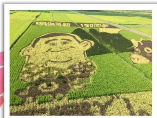
初めて見て感動した田んぼアート