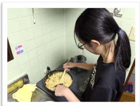
海老麺の店は準備中～

これからも日本について色々な学びを深めながら、シンガポールのことを紹介し、鹿児島の皆様と強い絆を作って、シンガポールと鹿児島の関係を強化したいと考えています。皆様、どうぞよろしくお願い致します！